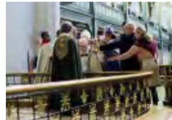
Under forbønnshandlingen deltok prester, utenlandske biskoper og nasjonale og regionale kirkeledere.