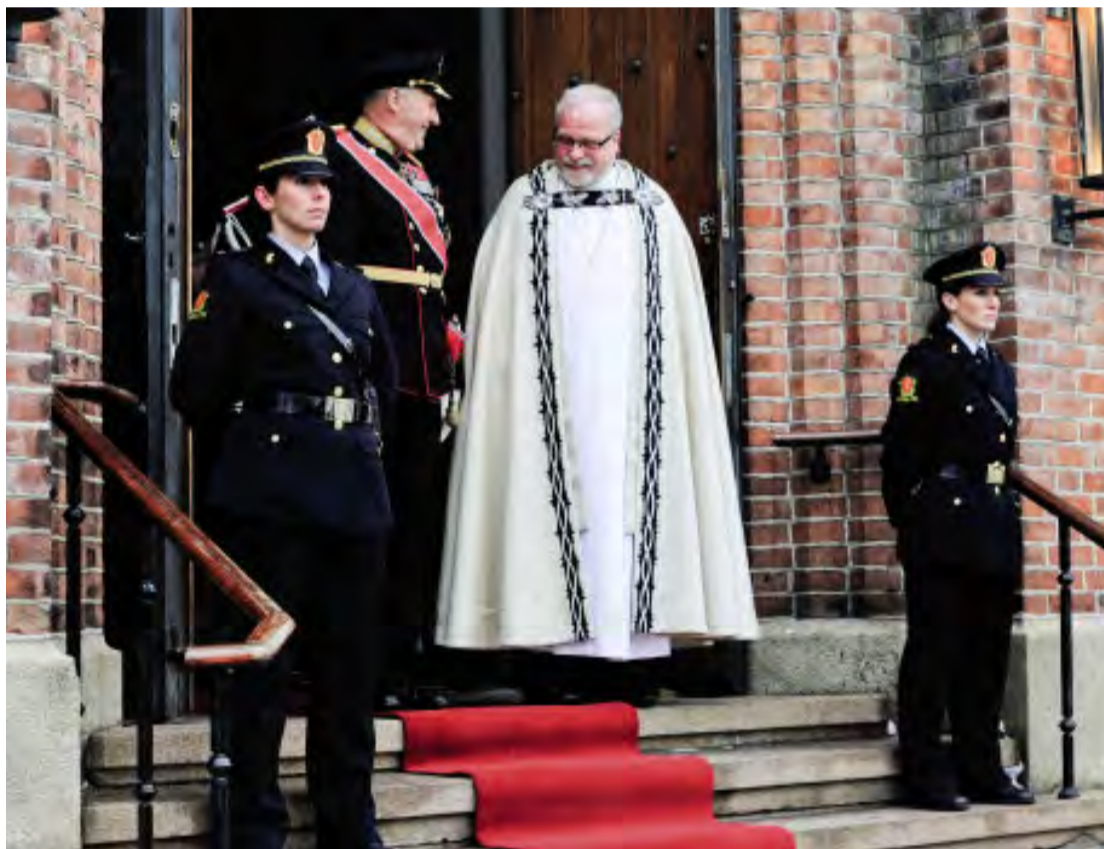
En hyggelig prat på kirketrappe mellom to av landets ledere, HMK Harald og nyslått biskop Sommerfeldt.

Dette ble en fantastisk opplevelse! Nyvigslet biskop Atle Sommerfeldt var strålende fornøyd etter vigslingsgudstjenesten i en fullsatt Fredrikstad domkirke.