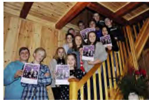
Konfirmanter i Hærland reklamerer for fasteaksjonen.

- I fjor fikk vi inn kr 88.135,-. Det var vi veldig fornøyd med, samtidig hadde det vært moro om vi klarte å samle inn enda mer i år, sier soknepresten.